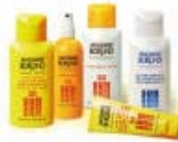
krema/mljeko za sunčanje